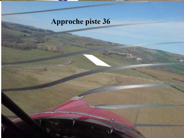
Approche piste 36